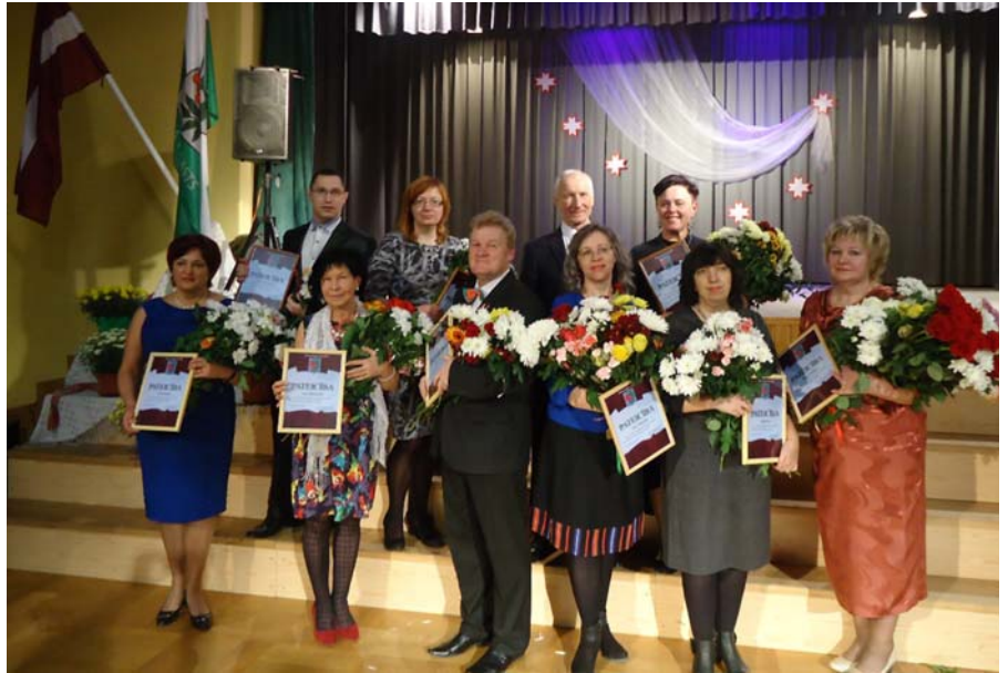
Kopējā foto nav Zīnas Drozdovas.