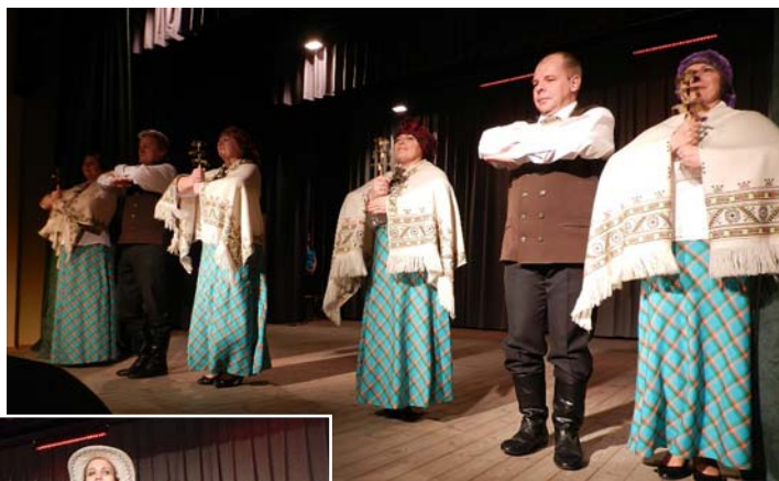
„Gatves deja” – „Ķekara” izpildījumā.