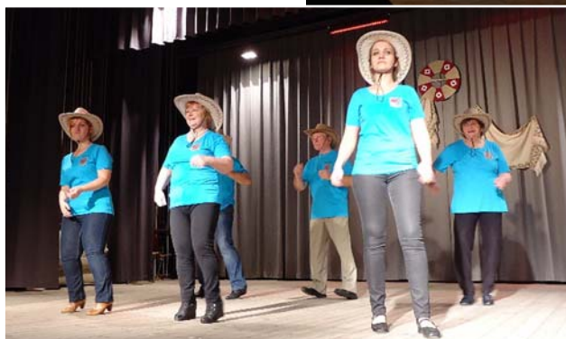
Līnīdejas dejo „Aronieši”

„Prieks ir dzīvot, Prieks ir izstarot gaismu. Prieks ir dot, ne tikai ņemt. Prieks ir mīlēt un piedzimt no jauna. Prieks ir tad, kad tu jūties – Cilvēkam, mežam, laikam, pats sev Un visai pasaulei vajadzīgs!”