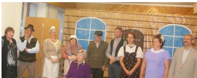
Piedalāmie viss kolektīvs.

22. jūlijs – „Aroniešu” svētki – „Preilenītes” pirmizrāde. Visu sezonu esam gājuši uz to – mēģinājuši, apspriedušies un meklējuši labāko variantu dažādās situācijās.