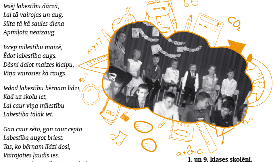
1. un 9. klases skolēni.