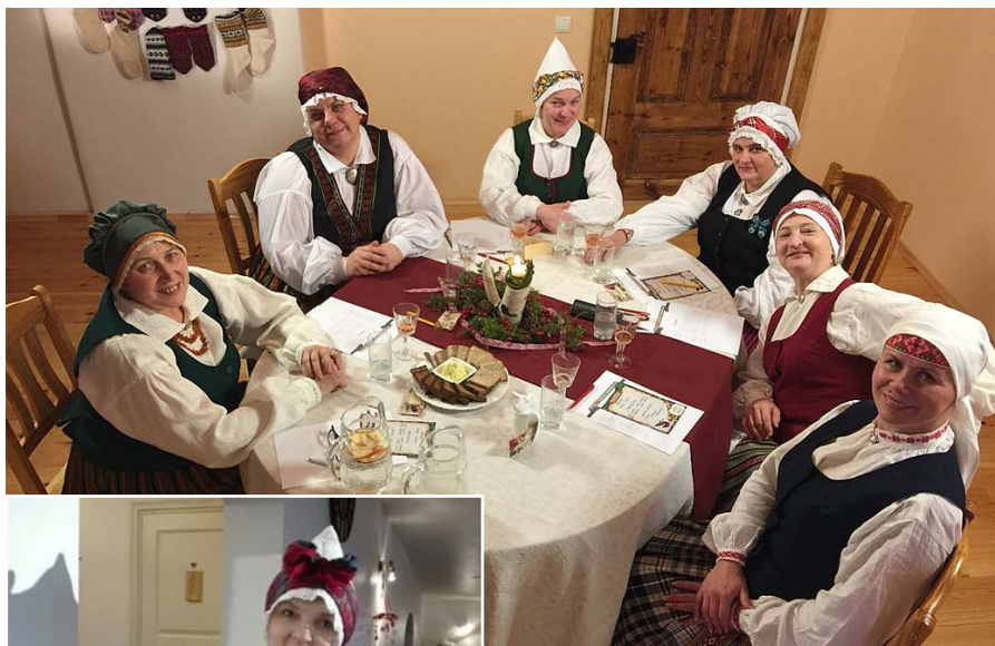
Saimniece „Lielajos Kupros”.