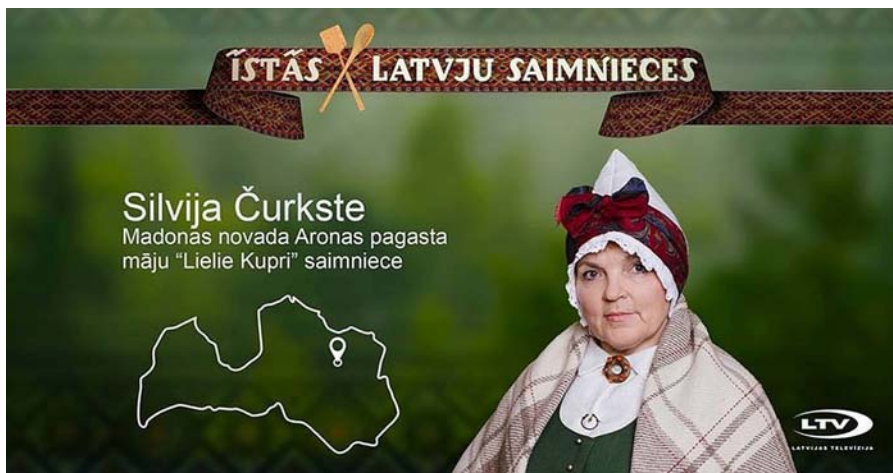
Autors – Matīss Markovskis

Silvija aktīvi piedalījies dažādos projektos, pati pabijusi partneru zemēs