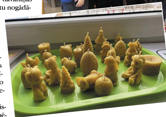
Vēlreiz paldies visiem vecākiem un lai svētīgs šis svētku laiks.