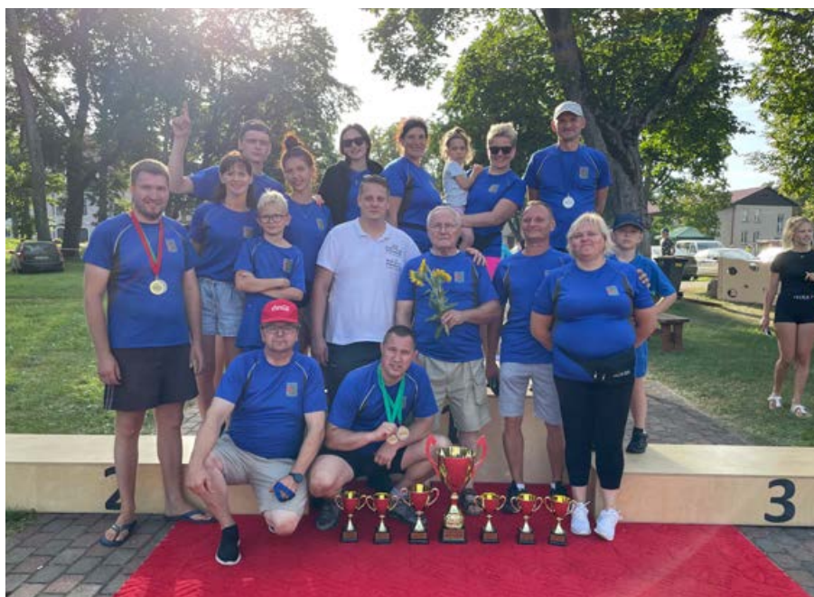
Aronas pagasta komanda Madonas novada pašvaldības darbinieku sporta spēlēs

Gaidījām rezultātus kopējs rezultāts, tika noskaidroti individuālo disciplīnu ieguvēji.