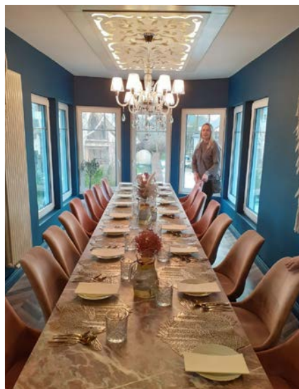
Pieredzes baruciena "Viedās kopienas Kurzemē" pieturas punkti jūras krastā

Divu dienu pieredzes apmaiņas brauciens "Viedās kopienas Kurzemē" pie vietējās rīcības grupām veda cauri vairākiem pieturas punktiem – Tīngeres muižai, Dundagas pilij (Talsu nov.), Ances muižai (Ventspils nov.), Slīteres nacionālajam parkam, Kolkasragam, Kolkas lībiešu saieta namam, Tukuma nov. – ģimenes uzņēmumam "Kukul" (maize & māksla, alus) un Mācītājmuižai Engurē, Lapmežciema muzejā, Smārdē.