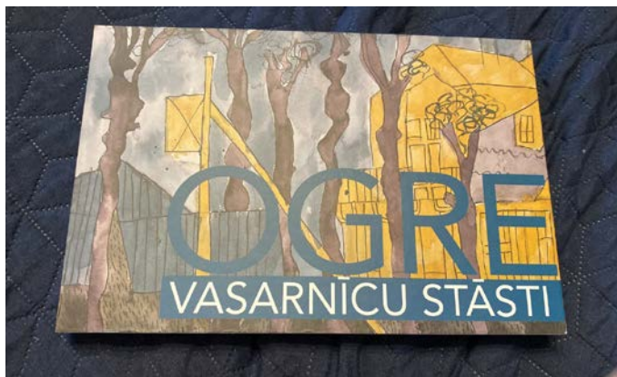
Lapaspuses no grāmatas "Ogre. Vasarnīcu stāsti"

Kopumā "NVO tirgus" sfēra, bija iedvesmojošs iedrošinājums virzīt mūsu ieceres arī tad, ja uzreiz nesanāk, jo visas biedrības kādā brīdī piedzīvo kritumus un pat darbības pārtraukumus, dalībnieku un līderu maiņu.