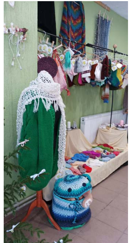
Miļ'darbu tirdziņš un Ziemassvētku vecītis "Ingas FoTo"