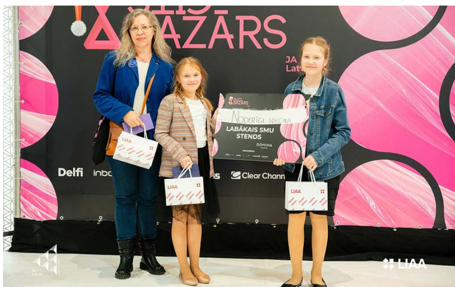
Nominācija "Labākais SMU stends" ir augstākais darba novērtējums SMU "Noderīgi niecīni" darbošanās laikā.