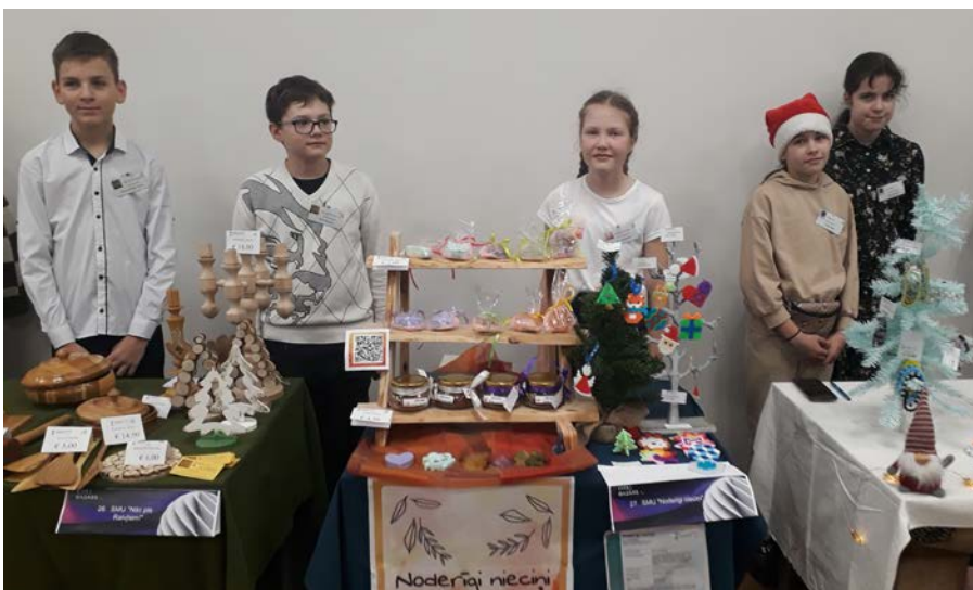
No kreisās SMU "Nāc pie Raivjiem!", SMU "Noderīgi niecīni" un SMU "Rotas tev"

Un šķiet, ka, darbojoties šajā pulciņā, lietā tiek liktas prasmes, ko apgūst visos mācību priekšmetos. Matemātika – ne tikai tirgojot, bet arī pareizi aprēķinot preces cenu, datorika – vizītkaršu izveidošanā, reklāmas ievietošana sociālajos tīklos, latviešu valoda – prasme prezentēt, atbildēt uz jautājumiem, vizuālā māksla – logo izveidē un izteiksmīgāko krāsu izvēlē, angļu valoda, jo ir bijuši pircēji, ar kuriem jāsazinās angļu valodā. Lai izturētu 5 – 8 stundas stāvēšanu kājās, jābūt gana izturīgiem un lieliski noder sportiskais rūdiņš. Rokdarbu prasmes, ko apgūst mācību priekšmetā dizains un tehnoloģijas, noder smalkākas preces – produkta gatavošanā.