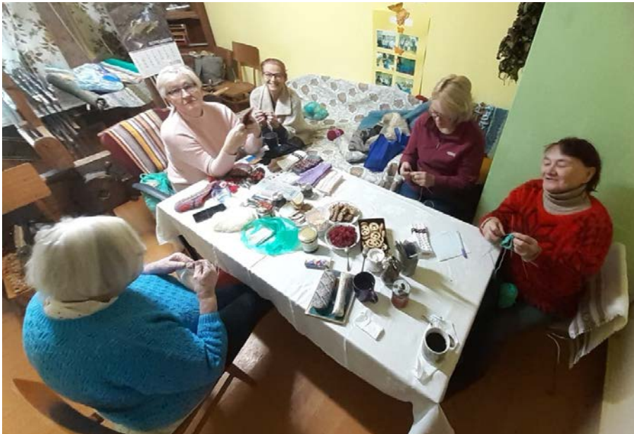
Darbnīca “Apgūstam kopā!”

Gada nogalē esam piedzīvojuši vairākus notikumus – Miļdarbu klubs “Zelgauska” ir kļuvis par Lauteres kultūras nama interešu pulciņu, piedalījāmies NVO (nevalstiskās organizācijas) tirgū Madonā, sarīkojām Zelgauskā puscimdu un mauču darbnīcu “Apgūstam kopā!” piedzīvojām pieredzes apmaiņas braucienu “Viedās kopienas Kurzemē” pie vietējās rīcības grupām un noorganizējām Miļdarbu tirdziņu un foto ar Ziemassvētku vecīti Madonā “Ingas FoTo” telpās (preti “Konzumam”, kas norisinās līdz 29. dec.). Par visu to šajā rakstā.