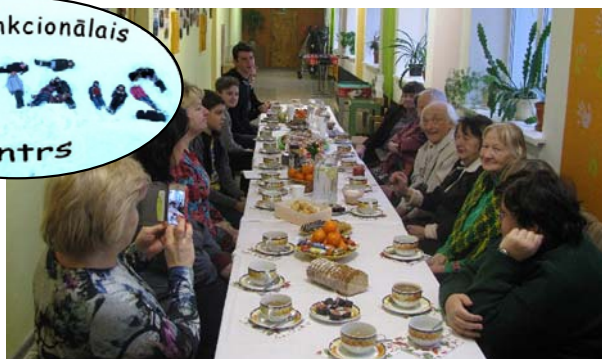
„Baltā galdauta svētki” MC „1. stāvs”.